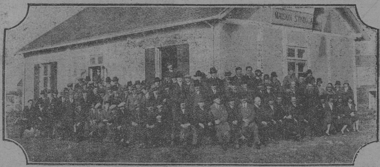
Inauguration de la MAISON SYNDICALE du Syndicat d'Indret

« Ah ! si vous, chrétiens, saviez manier plus puissamment le levier AIMEZ-VOUS LES UNS LES AUTRES, comme vous dominerez la question sociale ! » (CLEMENCEAU).