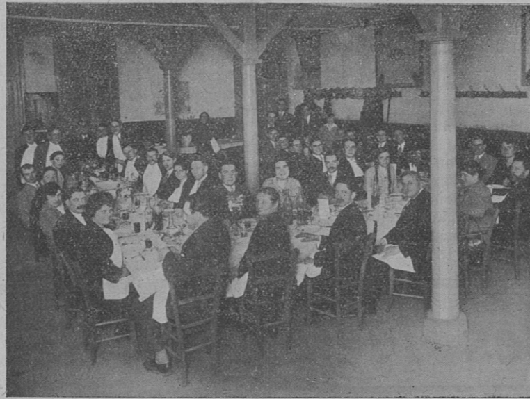
La Saint Jean P. L. à Nantes. — Banquet du Syndicat du Loire