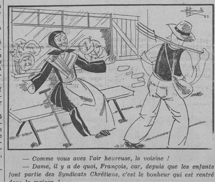
— Comme vous avez l'air heureuse, la voisine ! — Dame, il y a de quoi, François, car, depuis que les enfants jont partie des Syndicats Chrétiens, c'est le bonheur qui est rentré dans la maison !