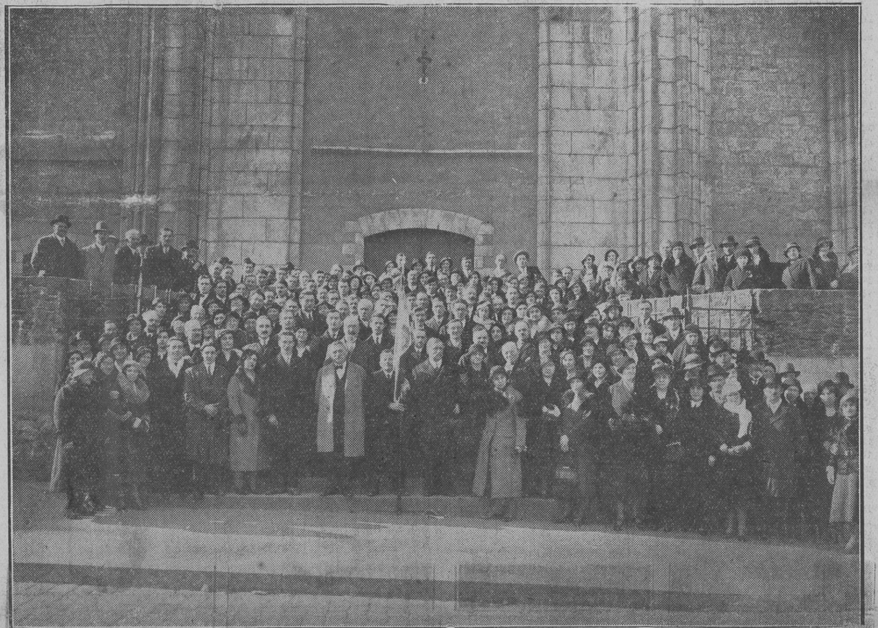
UN GROUPE DE CONGRESSISTES SUR LES MARCHES DE L'ÉGLISE SAINT-SIMILIEN, A NANTES