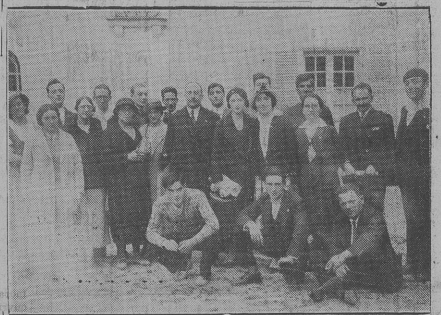
Les représentants de l'Union Régionale de l'Ouest à la XIII e Session Confédérale

Au lendemain du Congrès international sur le « travail industriel de la mère et le foyer ouvrier », promouvoir les œuvres éducatives et les œuvres d'entraide, les institutions sociales et les formations qui permettront au foyer populaire de vivre sans le travail de la femme au dehors et de retrouver, par la présence de la mère, son âme, sa vie, sa fécondité.