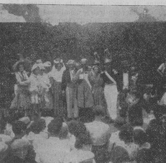
La Partie Concert à la Sortie du Syndicat des Métallurgistes de Nantes

Il y a aujourd'hui un mieux, parce que dans l'ordre social comme dans l'ordre économique, la réduction du capital d'une part, la création de sécurités en faveur des revenus du travail d'autre part, ont été réalisées.