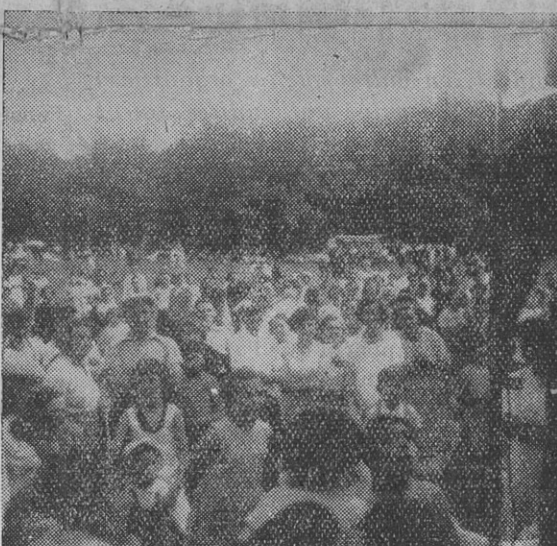
Une Sortie du Syndicat des Ouvriers Métallurgistes à la Haie-Fouassière

À la suite du mouvement des grèves de Juin 1936 les accords dits « Matignon » ont fixé une augmentation des salaires et traitements allant jusqu'à 15 %. D'autre part les lois concernant les congés payés, la semaine de 40 heures et autres mesures sociales entraînent une aug-