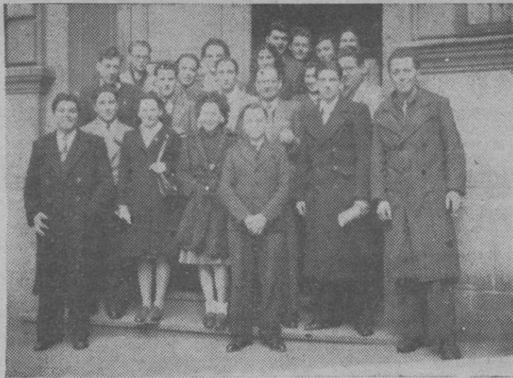
DES DÉLÉGUÉS A LA CONFÉRENCE DES JEUNES MÉTALLOS NANTAIS

La liste de nos voyages 1948 est parue : une trentaine de circuits différents avec 4 ou 5 départs chaque mois, entre autres : L'Auvergne : 10 jours pour 7.165 fr. ! Le Pays Basque : 10 j. pour 8.675 fr. ; La Côte d'Azur : 10 j. pour 6.870 fr. ; La Forêt Noire : 15 jours pour 8.270 fr.