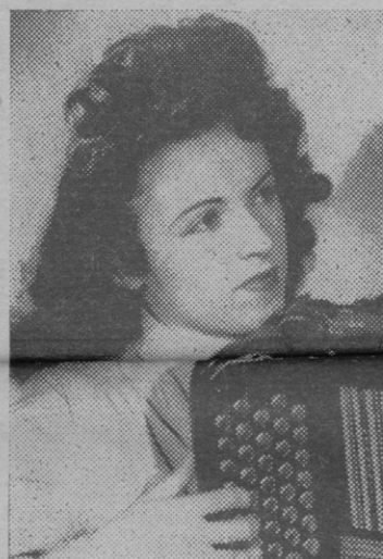
YVETTE HORNER Championne de France d'accordéon