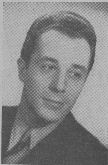
JEAN-PIERRE DUJAY Vedette de la Radio

organisé par l'Union Départementale et l'Union Locale des Syndicats Confédérés et réalisé par le Syndicat National des Artistes de Variétés de Paris.