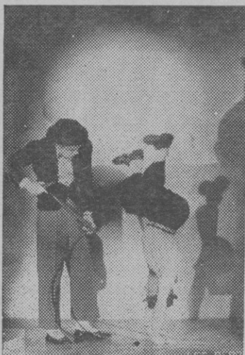
LES BEROS Cascadeurs comiques