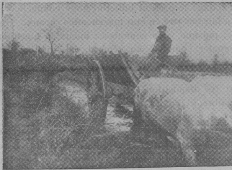
Pour se rendre aux champs le conducteur est obligé de monter en charrette pour conduire son attelage

rés pour l'entretien des chemins vicinaux et que la loi de 1881 sur les chemins ruraux ne donne, au même préfet, sur ce point, aucun pouvoir de coopération.