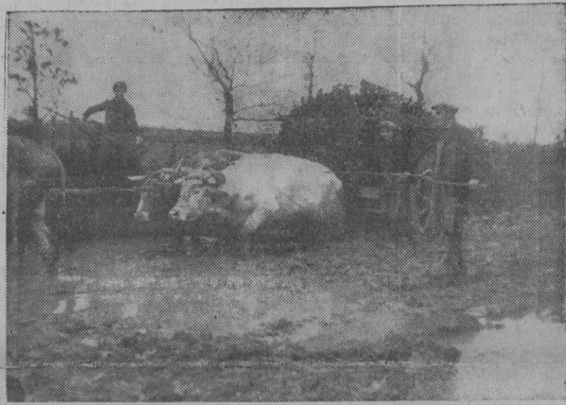
Une vue de nos attelages pendant l'hiver pour rentrer les choux (Photo prise à 50 mètres de la ferme). On peut juger de l'état du chemin qui sur une longueur d'un kilomètre relie la route à deux grandes fermes

Les Paysans en s'unissant ne doivent pas avoir seulement pour but de formuler des plaintes, mais d'étudier ensemble les solutions des problèmes qui se posent pour l'avenir de l'Agriculture Française.