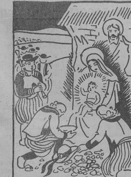
Petit enfant Jésus, ne dans une crèche pour marquer votre amour pour les humbles...

(Voir au bas de la 3 e page la suite de notre chronique générale.)