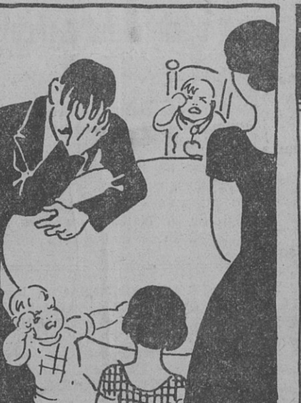
pour que puissent avoir du pain tous ceux qui ont faim.....