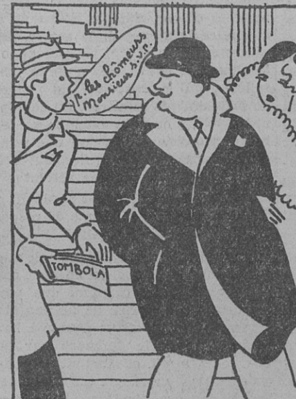
Donnez le sens social à ceux qui ne l'ont pas...