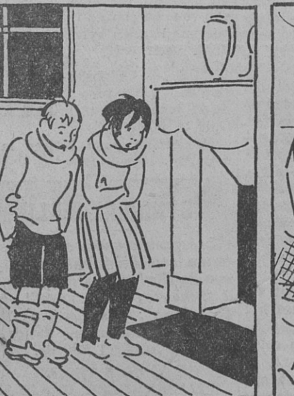
et pour que puissent se réchauffer tous ceux qui ont froid.....