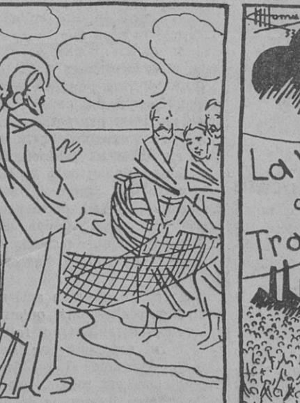
Vous, qui avez choisi vos apôtres dans le peuple pour marquer la confiance que vous avez dans le peuple