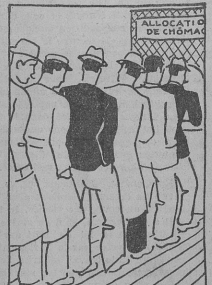
et du travail à ceux qui n'en ont plus.....