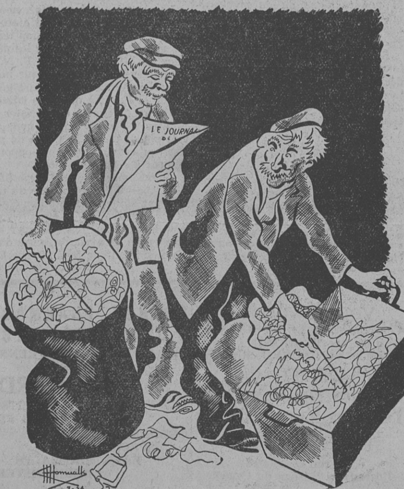
— Eh ! dis, Nénesse, le père Gastounet vient de supprimer la taxe de luxe. Tu te rends compte ? — Ben, mon vieux, c'est pas trop tôt !

2 o Ne puisse occuper les après-midi de semaine anglaise et le septième jour de la semaine un ouvrier qui aurait travaillé les six autres jours chez un patron.