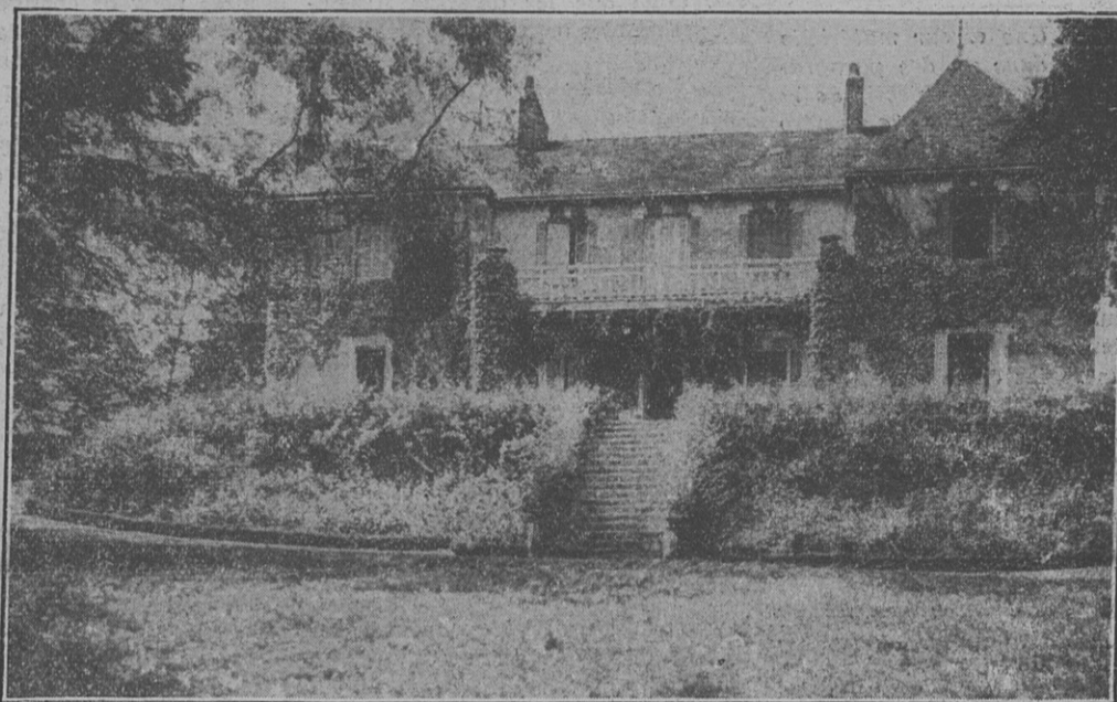
LA MI-COTIERE (par Oudon (Loire-Inférieure))

Aussi, formons-nous le vœu que tous les confrères de Saint-Vincent de Paul soient bien pénétrés de cette idée que leur Société ne doit pas se borner à avoir seulement, vis-à-vis du prochain, cette vertu curative que tous lui reconnaissent, mais qu'elle doit, aussi, par la collaboration de tous ses membres, arriver à posséder cette vertu préventive, ignorée encore de certains, si pleinement conforme à la doctrine sociale de l'Eglise, à la doctrine tout court de l'Evangile.