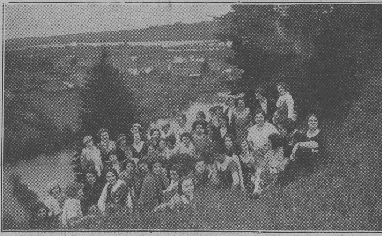
EN PROMENADE A LA MI-COTIERE. — GROUPE D E SYNDIQUES (par OUDON, Loire-Inférieure)