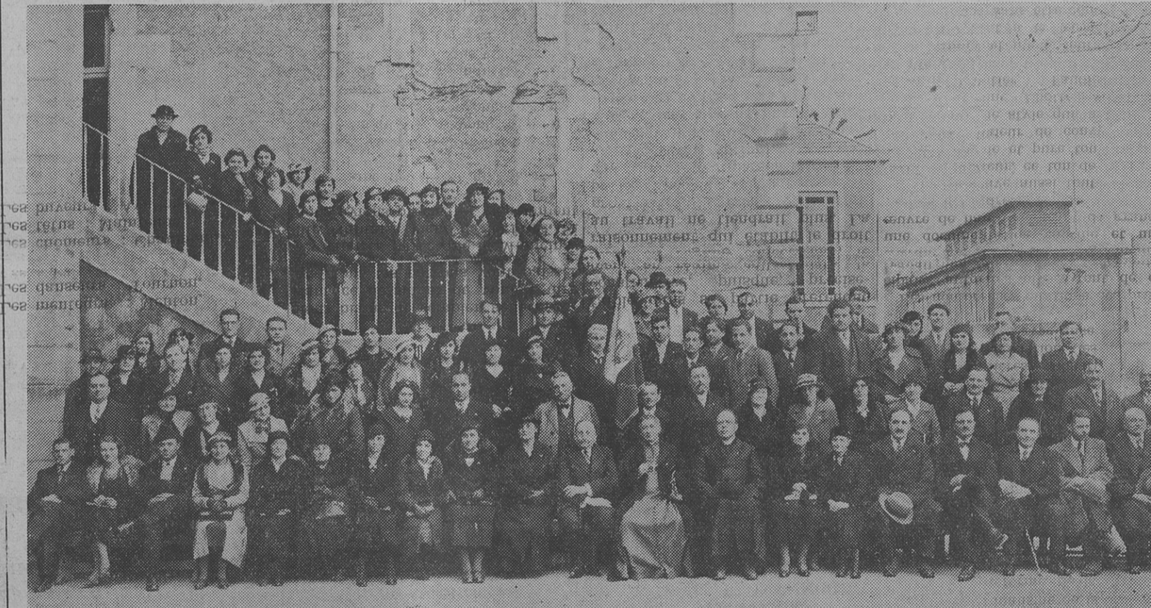
LES DELEGUES AU XII e CONGRES DE L'UNION REGIONALE DE L'OUEST, A POITIERS

L'exposé de l'orateur fut suivi d'une discussion très animée.