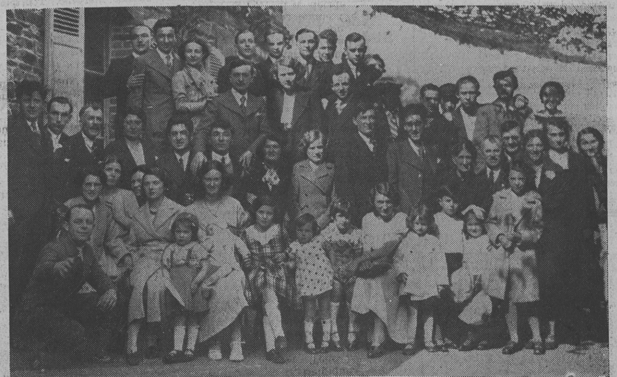
LA SAINT-JEAN-PORTE-LATINE A RENNES