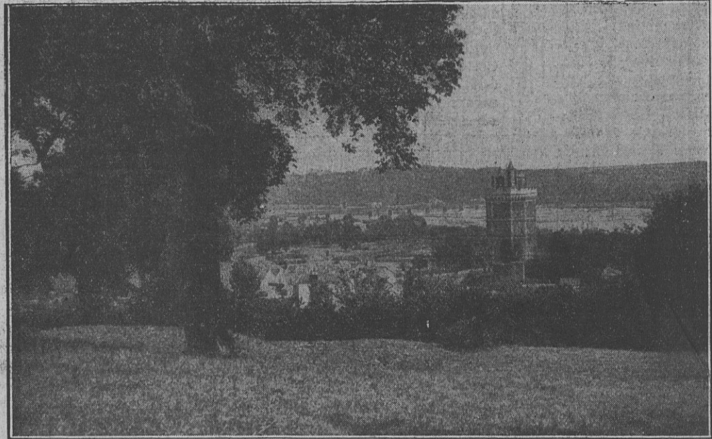
LA MI-COTIÈRE. — Vue prise du Parc, sur Oudon et la Loire