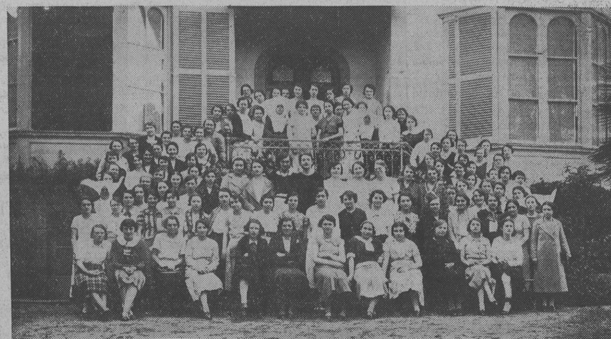
LES SYNDICATS FEMININS DE RENNES Le Griffon en promenade à Saint-Briac

Pour masquer son échec, la C. G. T. U. communiste, qui, pas plus que la C. G. T. n'a d'adhérents dans la couture parisienne, a réusé, par ses méthodes habituelles d'agitation, à prolonger d'une journée la grève des Midinettes, qui sont finalement rentrées aux conditions obtenues, l'avant-veille, par les syndicats chrétiens.