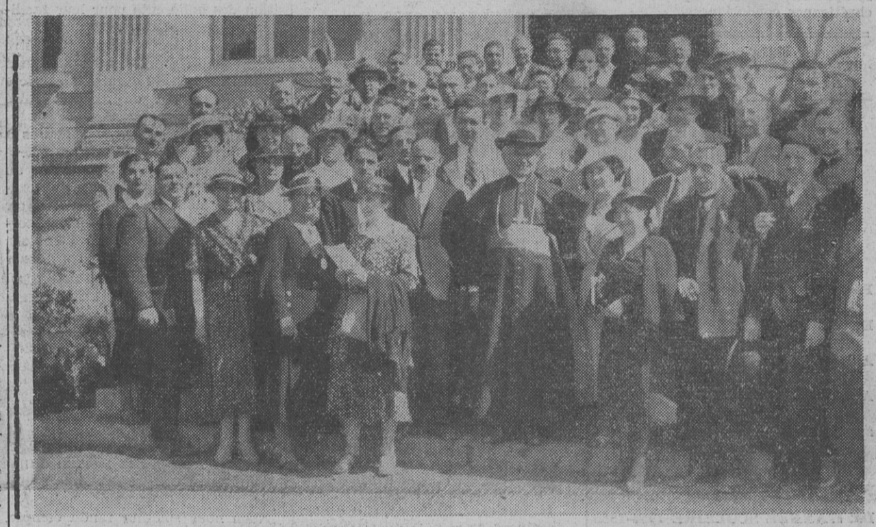
A la Semaine Sociale d'Angers : groupe de Cettécistes et d'amis de la C. F. T. C.

C'est par la pratique du devoir d'Etat que les chefs et les membres des diverses corporations demeurent unis : « La différence des talents est compensée par la communauté des vertus ».