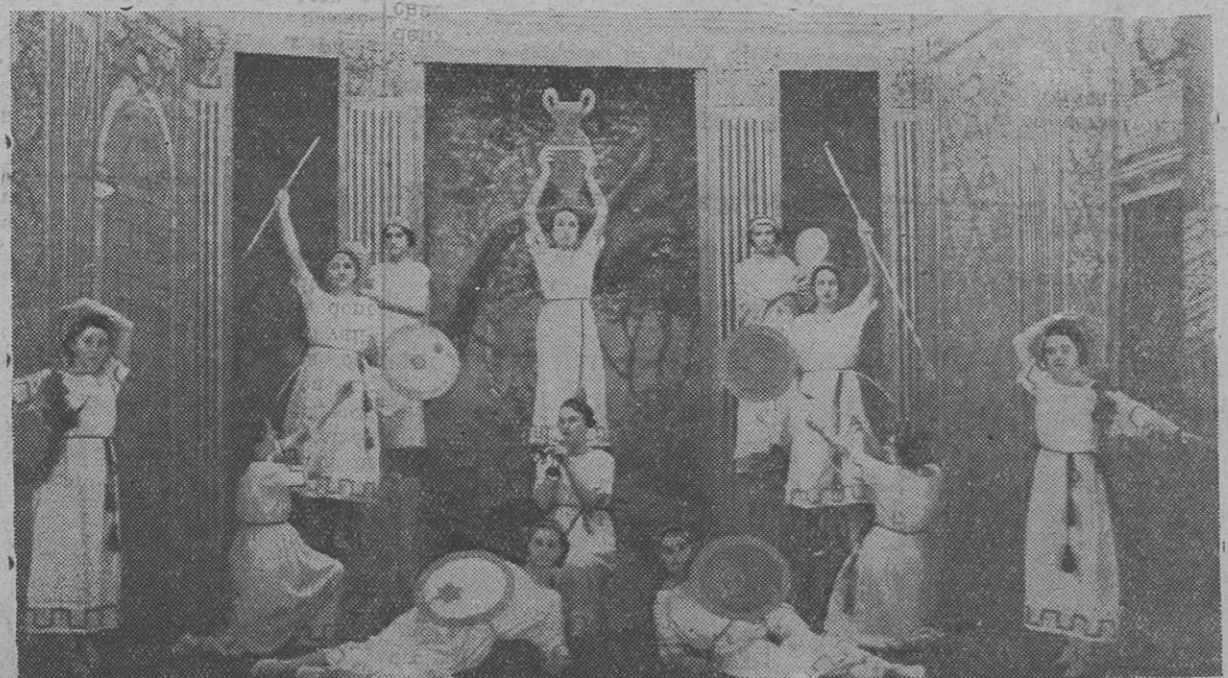
FETE DES CATHERINETTES AU « GRIFFON », A RENNES Apothéose du Ballet Grec

Et c'est bien autre chose encore, si on jette les yeux sur ses succédanés de province, qui puent l'anticléricalisme et la bêtise.