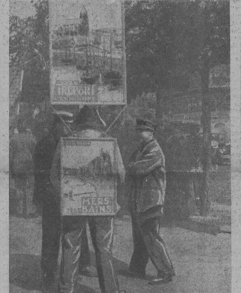
L'HOMME SANDWICH Est-ce compatible avec la dignité humaine ?

Les vœux adoptés en conclusion requièrent un régime plus sévère de placement et une réglementation reconnue indispensable des offres d'emploi confiées à la presse.