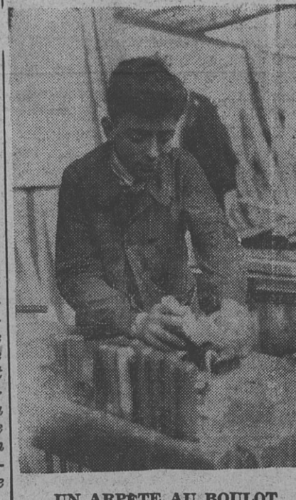
UN ARPETE AU BOULOT

Nous demandons à nos amis de nous faire parvenir leurs clichés sur papier glacé, dans n'importe quel format. Les clichés non passés seront rendus. Attention ! pour un bon cliché dans le journal, une bonne photo bien contrastée ! Merci d'avance ! LA REDACTION.