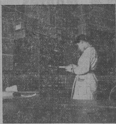
Les Services Administratifs de l'U. R.

Un autre devoir aussi impérieux, c'est la propagande ; dans tous les centres, il y a encore de nombreux fonctionnaires, cheminots, agents des services publics, qui ont des sympathies pour nos idées et n'attendent qu'une demande, qu'un mot de notre part pour venir à nous. Que chacun, dans sa sphère d'action, fasse cette démarche, dise ce mot qui amènera