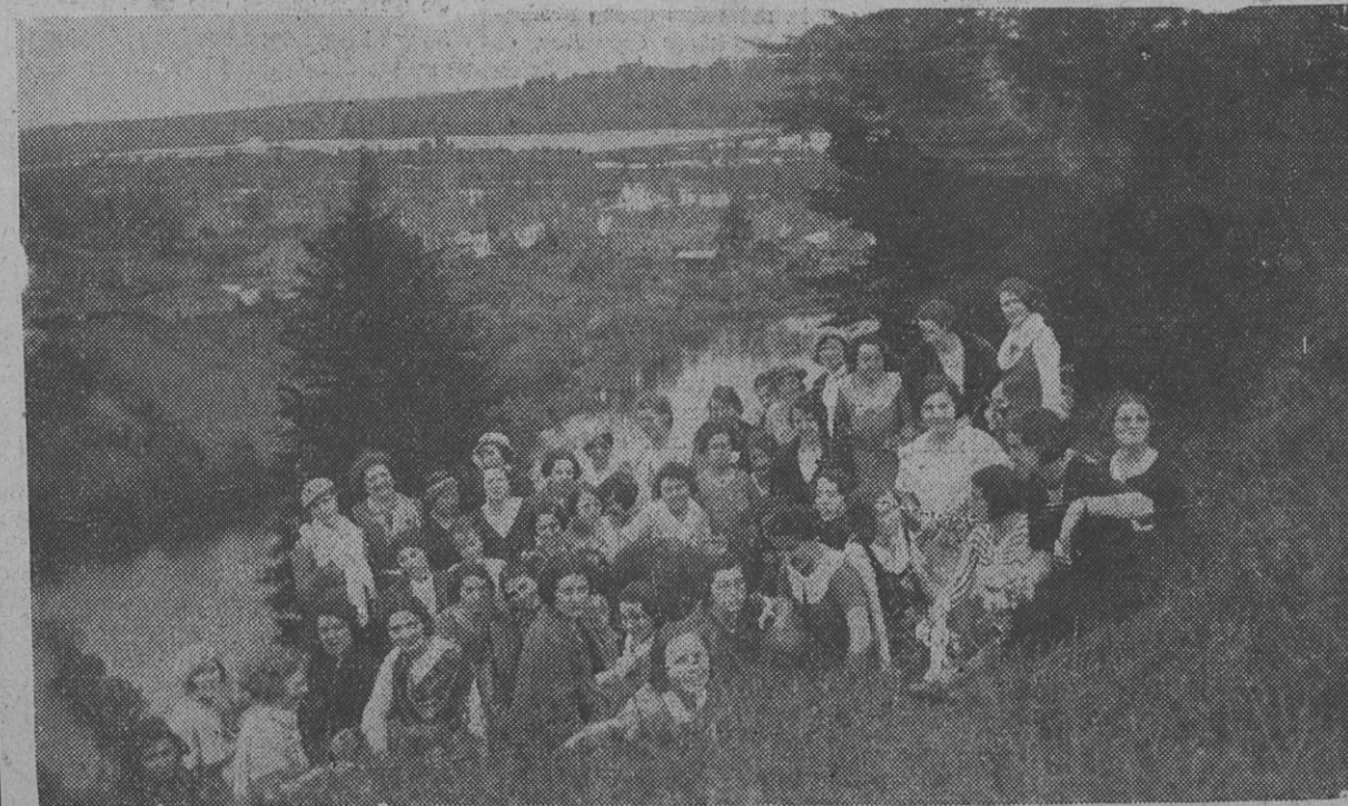
PROMENADE DES SYNDICATS FÉMININS A LA MI-COTIERE