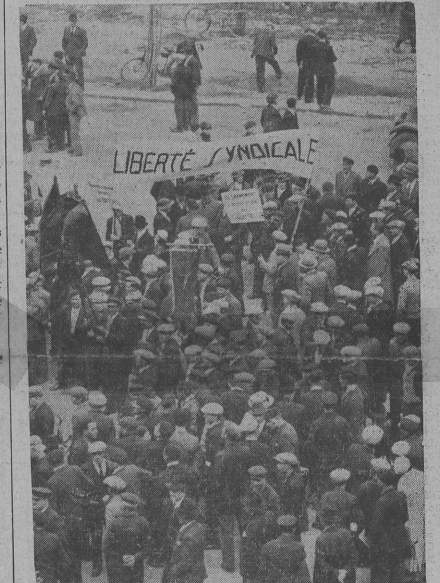
LIBERTÉ SYNDICALE ! POUR QUI ? (Voir l'article ci-contre.)