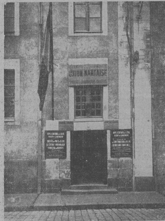
L'ENTRÉE DE L'IMMEUBLE DE L'UNION RÉGIONALE A NANTES