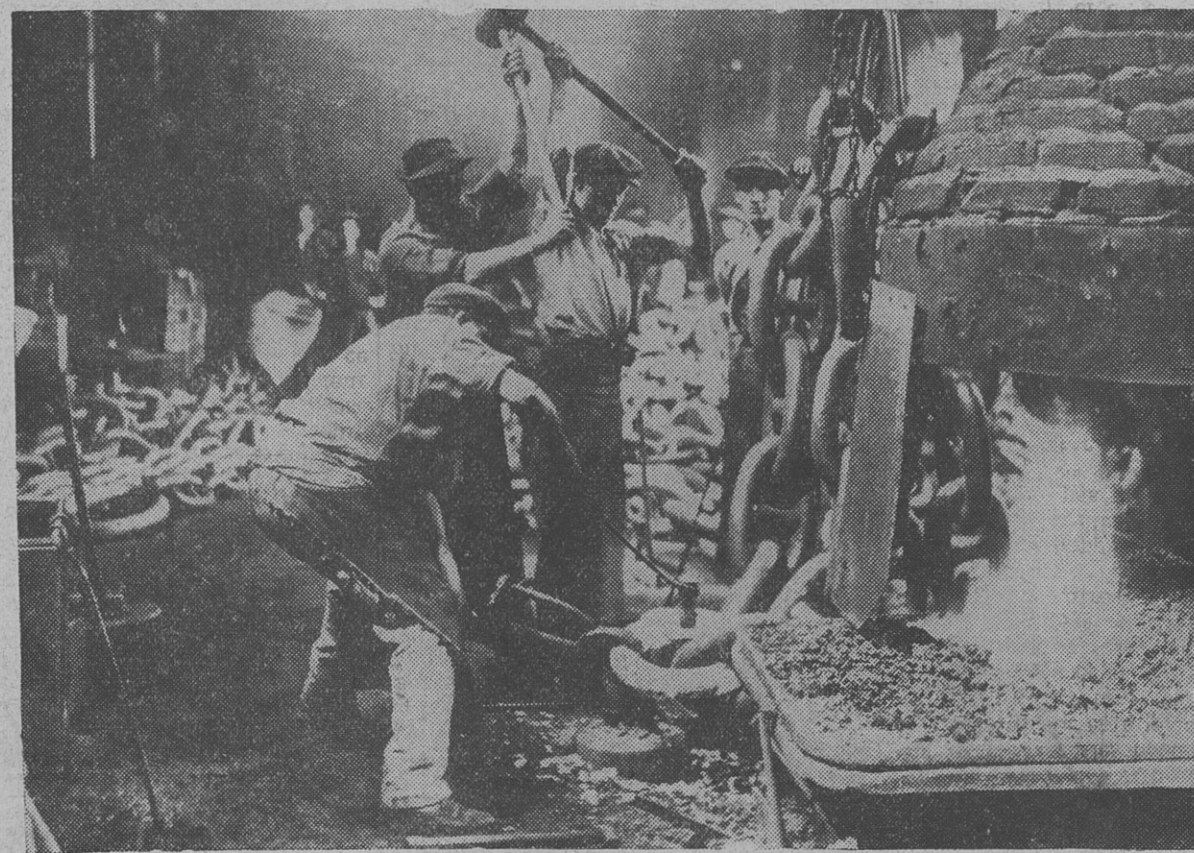
Coup d'œil chez les métallos... Ouvriers des chaîneries au travail

Repousse, en conséquence, l'occupation des établissements, les essais de prise de possession par les