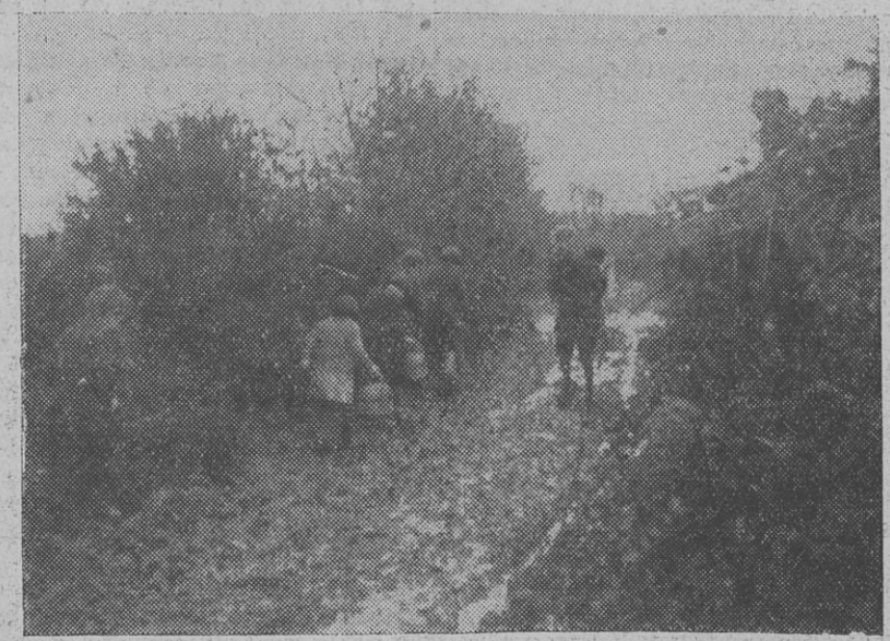
LES CHEMINS RURAUX En allant à l'école, les gosses pataugent et risquent la maladie

Elle est maintenant à l'Hôpital. On va peut-être la sauver, mais le mal a maintenant pris sur elle. Que va-t-il advenir de cette pauvre petite ?