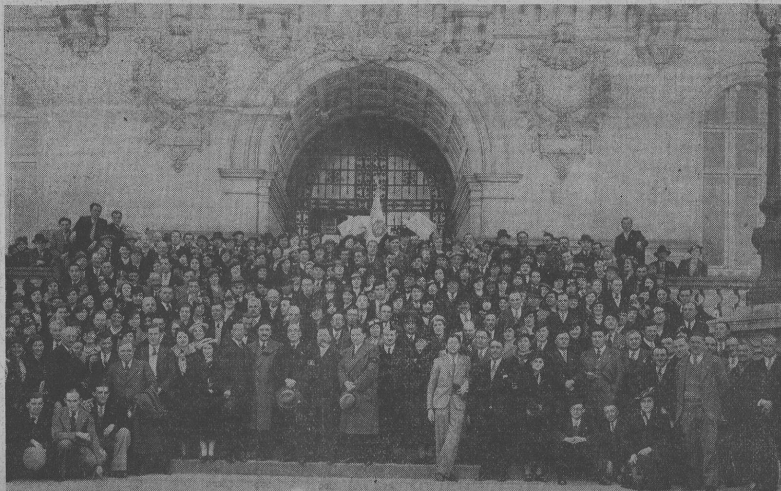
LES DELEGUES SUR LES MARCHES DE L'HOTEL DE VILLE OU ONT EU LIEU LES SEANCES