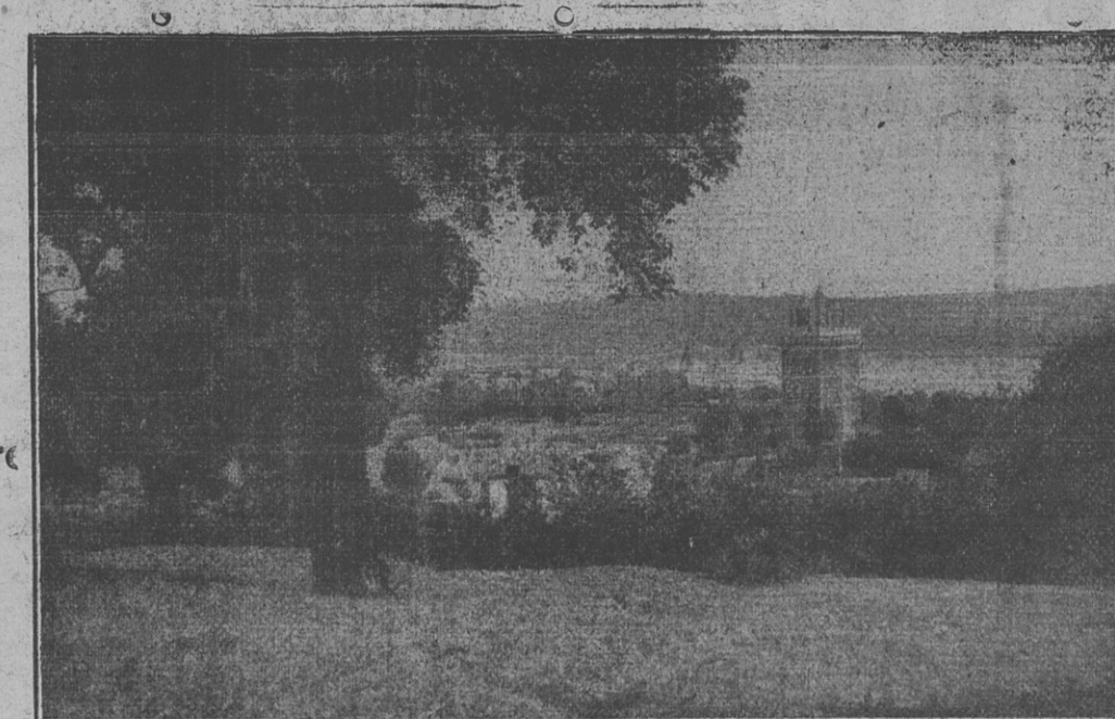
Vue prise du parc de la Mi-Côtière, sur Oudon et la Loire

Où passer nos Vacances A LA Mi-Côtière par Oudon (Loire-Inf.)