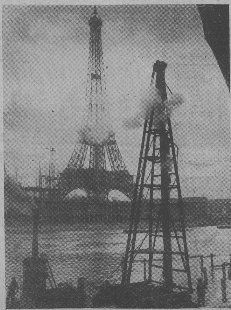
PARIS !... NOUS Y SERONS LES 26 ET 27 JUIN !

S. Em. le Cardinal VERDIER, Archevêque de Paris