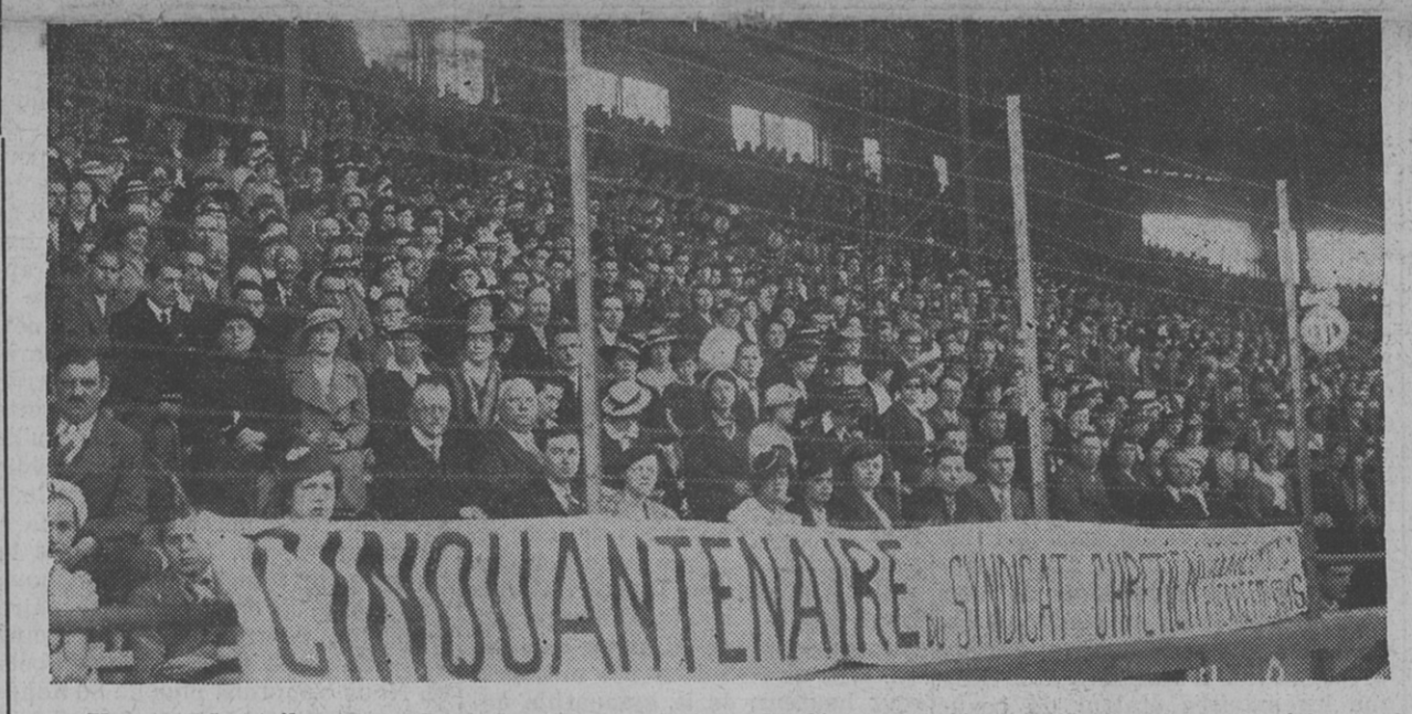
Une vue des tribunes, au Parc des Princes, le jour du Cinquantenaire du Syndicalisme Chrétien