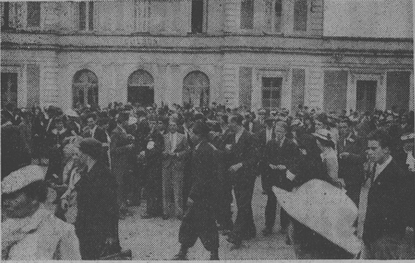
L'UNION NANTAISE EN EXCURSION A CLISSON La sortie de la gare