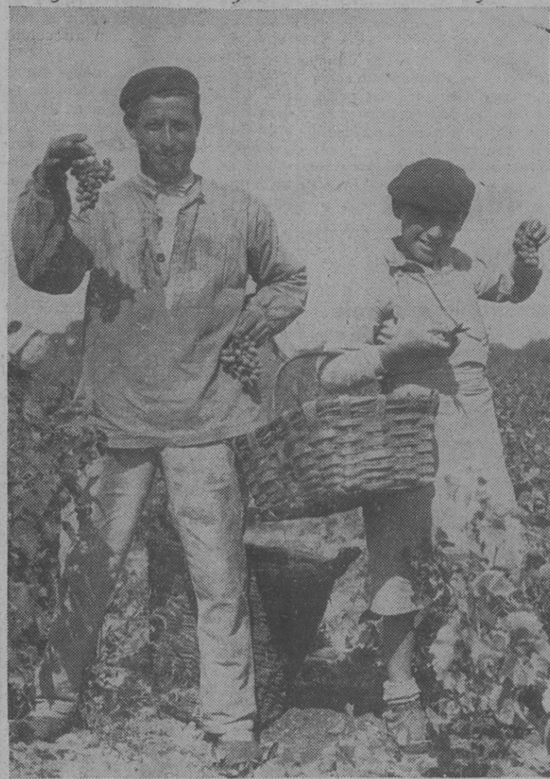
VENDANGES !... Pensons-nous au dur labeur de nos camarades ouvriers agricoles