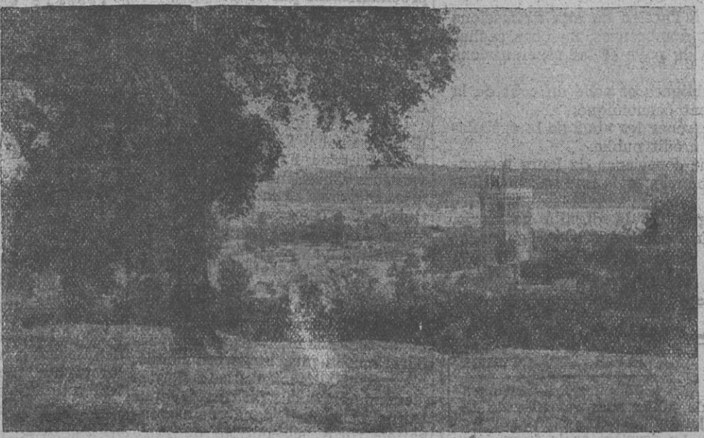
LA « MI-COTTIERE », à Oudon (Loire-Inférieure) Maison de repos ouverte toute l'année