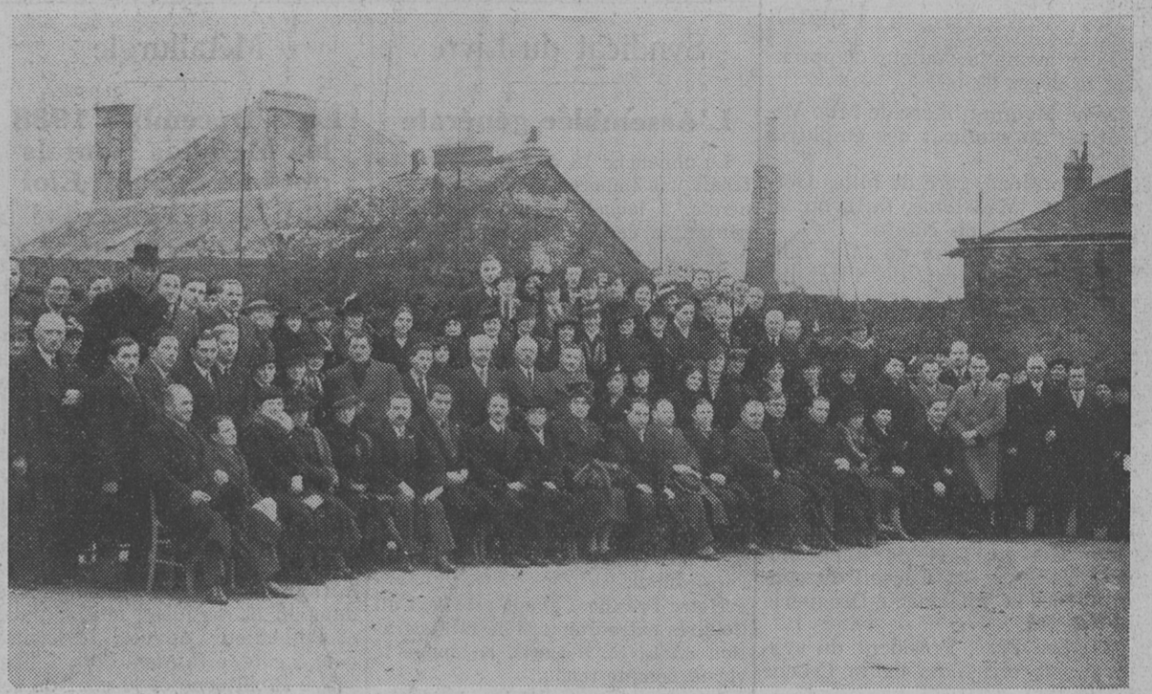
Le groupe des Congressistes