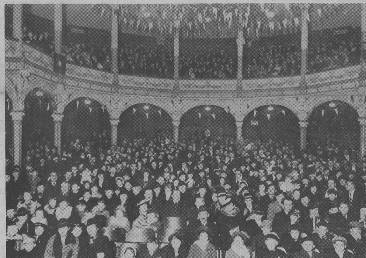
La belle assemblée de l'Arbre de Noël organisée par le Comité de Loisirs Nantais

« Lorsque l'enfant a fini de têter, il faut le dévisser et le mettre dans un endroit frais, tel qu'une fontaine ».