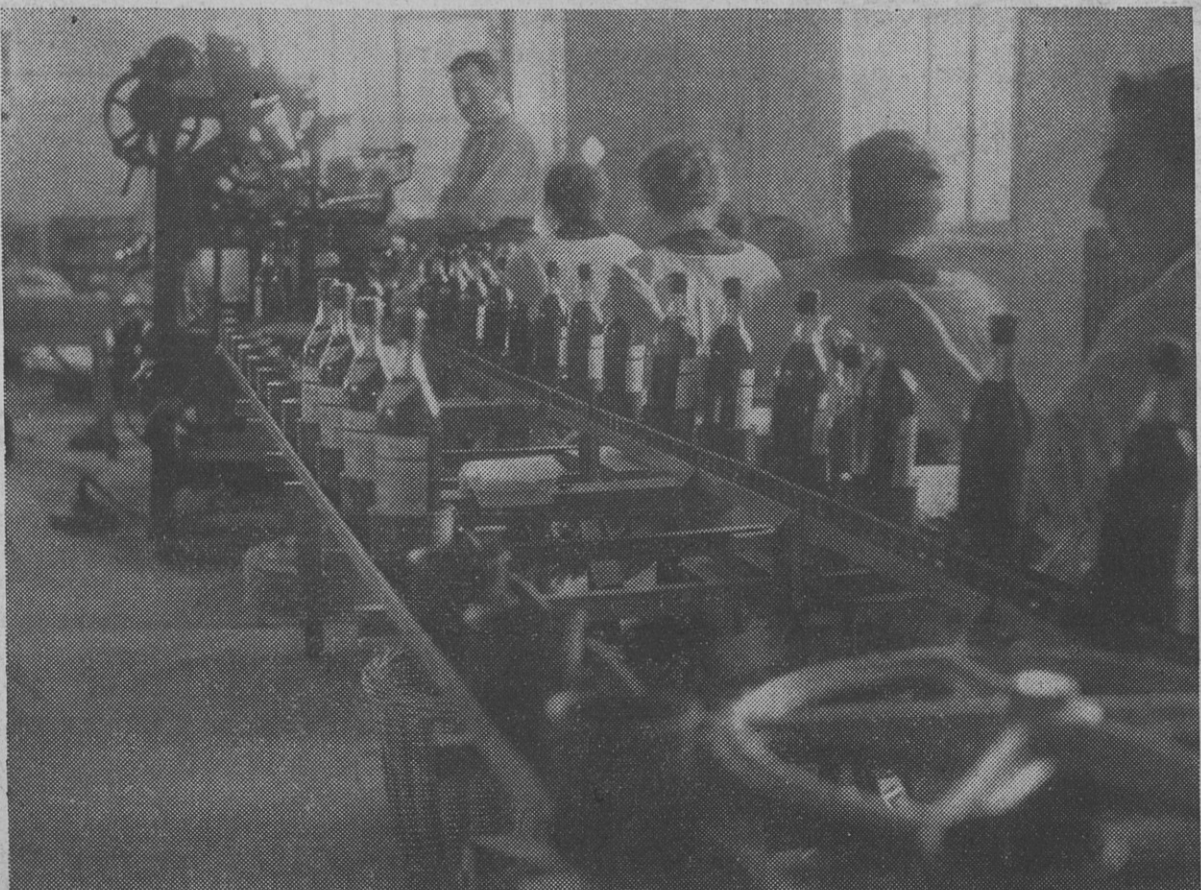
La place de la maman est d'être au service de ses enfants, et non au service de la production