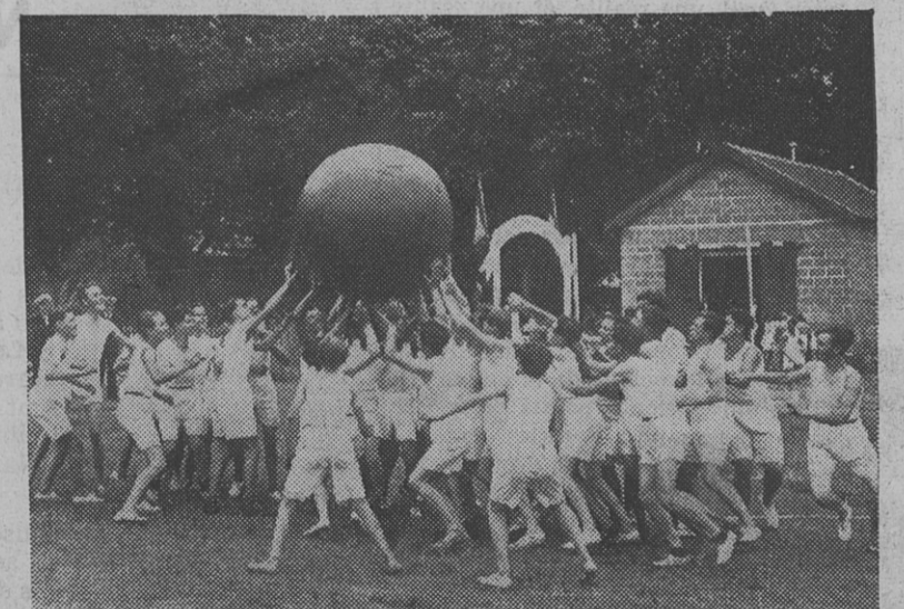
DETENTE !... dans une école professionnelle modèle où travail et loisirs sont sagement répartis