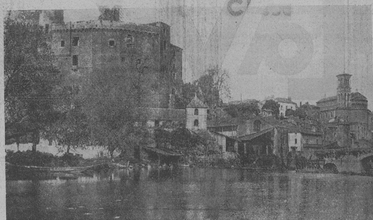
UNE VUE DE CLISSON : L'église Notre-Dame, le Château, la Sèvre