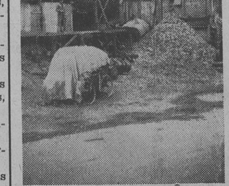
Dans le sud des Côtes-du-Nord on trouve beaucoup de carrières de pierres ou d'ardoises