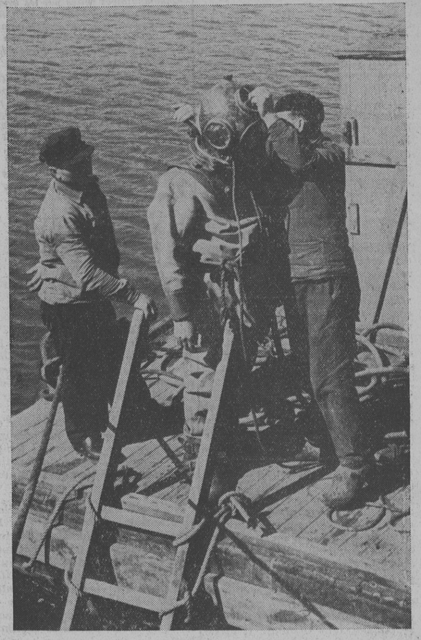
Le scaphandrier va descendre au fond du bassin. Le voici sur le radeau où est installée la pompe à refouler l'air.

Hermétiquement fermé, son appareil consiste en un casque, à forme sphéroïdale, évasé à la partie inférieure ; en un vêtement imperméable. Ses chaussures de cuir, garnies de grosses semelles de plomb, assurent sa verticalité dans l'eau. Ses deux aides (notre photo), assujettissent sur ses épaules le casque en cuivre et appliquent à l'arrière de celui-ci les tuyaux d'arrivée d'air.