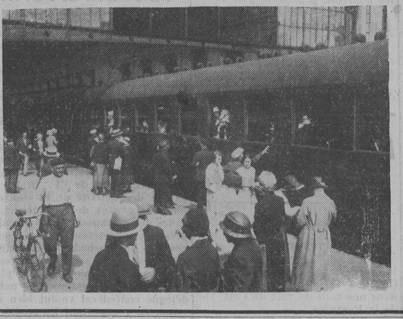
(avec légalisation de la signature comme indiqué ci-dessus).

Le carnet, qui comporte cinq feuillets est valable cinq ans sans nouvelle formalité (sauf changement de situation ou de composition de la famille). Le titulaire doit faire viser le feuillet de l'année en cours par son patron