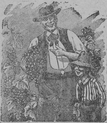
C'est aux Pépinières Girault que vous devez nos plus belles grappes.

Les plus beaux plants de vigne, meilleur marché que partout ailleurs, authenticité et sélection garanties.