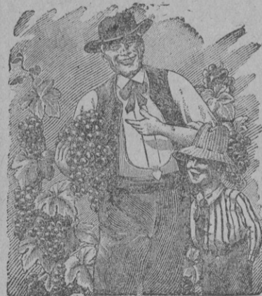
C'est aux Pépinières Girault que vous devez nos plus belles grappes.

La Maison accepterait Représentant sérieux