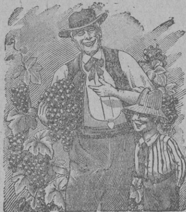
C'est aux Pépinières Girault que nous devons nos plus belles grappes.

La Maison accepterait Représentant sérieux