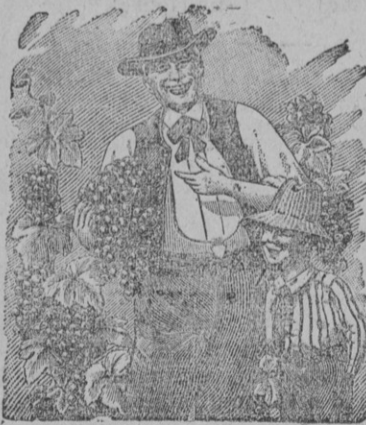
C'est aux Pépinières Girault que nous devons nos plus belles grappes.

La Maison accepterait Représentant sérieux