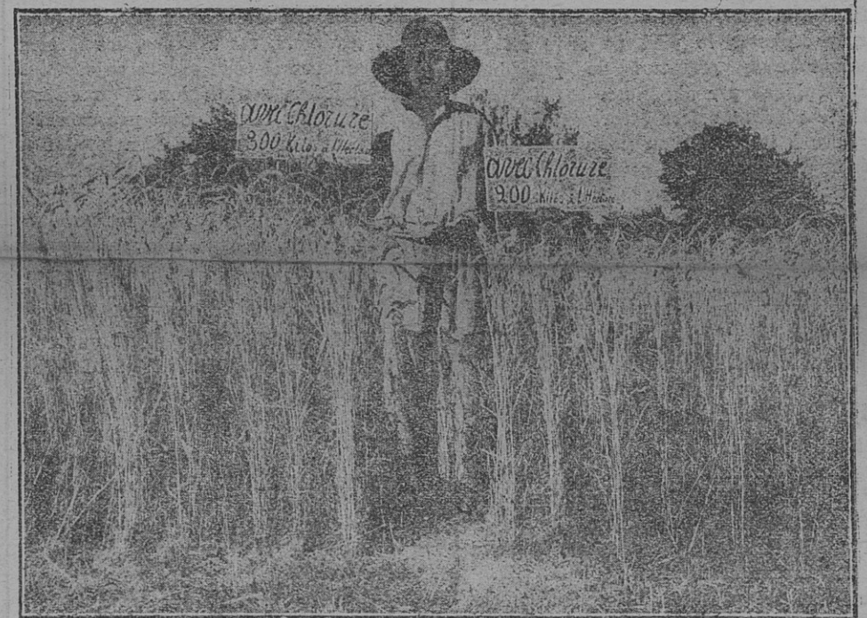
Vue de deux parcelles de blé, de la Ferme Expérimentale d'Avrillé, en 1928, avec des doses différentes de chlorure de potassium

QUELLES SONT LES TERRES QUI MANQUENT DE POTASSE ?