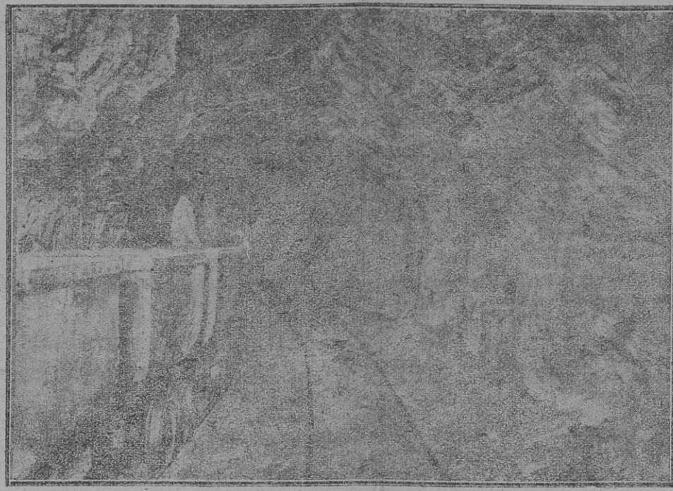
Vue intérieure d'une Galerie