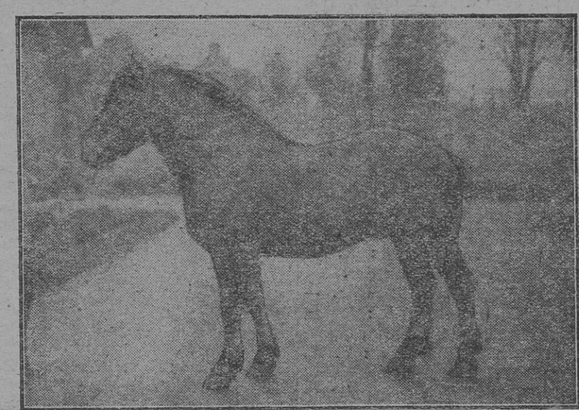
Type d'étalon de trait léger breton

L'élevage du cheval, dans le département de la Loire-Inférieure, était orienté au commencement du siècle vers la production du cheval de demi-sang pour le commerce de luxe et pour les besoins de l'armée. En 1903, une centaine d'étalons nationaux, tous de demi-sang ou de pur sang, étaient utilisés dans le département pour le service de près de six mille juments. Le commerce de luxe était à cette époque très actif en chevaux d'attelage, mais le développement de l'industrie automobile provoqua une crise qui alla s'accroissant jusqu'en 1910. Petit à petit, le carrossier qui n'avait plus son emploi cessa d'être demandé par le commerce et disparut. En même temps, l'agriculture réclamait des chevaux de trait ; l'emploi de plus en plus répandu des machines agricoles, la diminution de la main-d'œuvre, la nécessité d'aller vite, de gagner du temps, etc... faisaient rechercher par les agriculteurs la traction hippique. Certaines régions du département abandonnaient même complètement le bœuf pour cultiver avec des juments, qu'ils livraient en même temps à la reproduction.