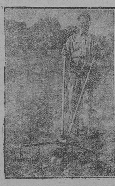
Les CULTIVATEURS Binage de deux interlignes de choux. Outillage passe à cheval sur la ligne du milieu. Largeur travaillée 0°95 ; profondeur 3 à 10 cm.