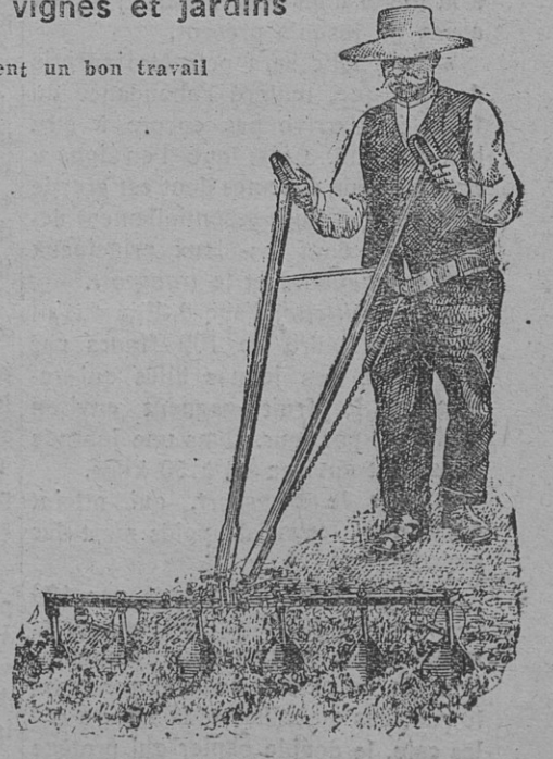
Les RAYONNEURS Travaux de 6 rayons à 0°24 d'écartement et 5 cm de profondeur. Largeur totale 1°15. Tout réglage à volonté.