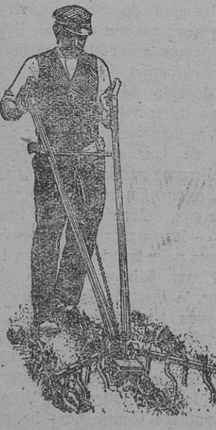
Le GRIFFE-TOUT Décaillage de deux interlignes de haricots. Largeur travaillée 0°70 ; profondeur 3 à 5 cm.

Les « Rétro-Forces » économisent beaucoup de main-d'œuvre et permettent un bon travail