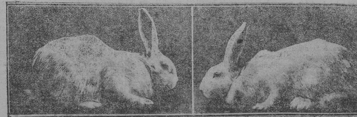
A gauche : Mâle. — A droite : Femelle.