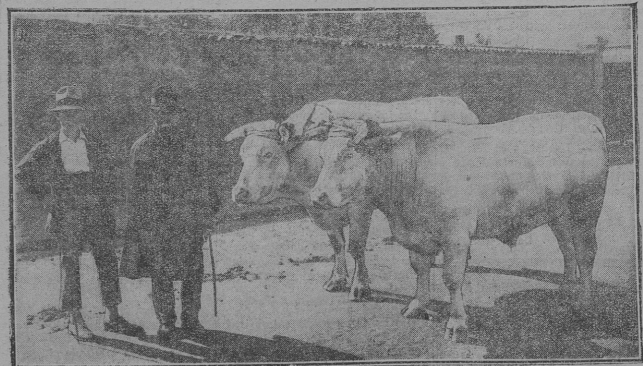
« MOUTON » et « CHARLOT », bœufs charolais élevés par MM. Joly frères, métayers à la ferme de la Chevrin, commune de la Genétouze (Vendée). Ces bœufs, qui atteignaient le poids de 2150 kilos, ont été vendus 12.000 francs.