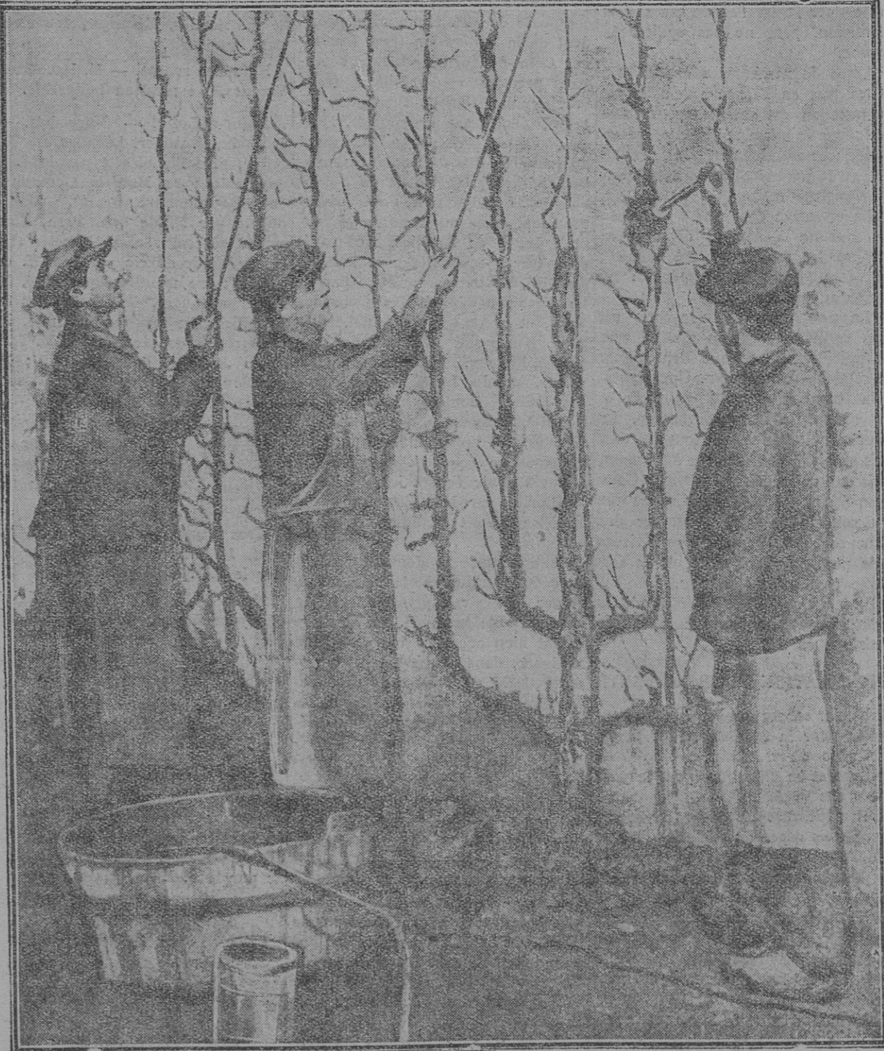
C'est une opération à faire pendant la saison de non végétation. On peut détruire avec succès les mousses, les lichens et une foule d'animaux parasites.